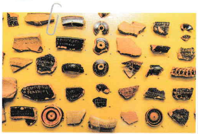
Fragmente ceramice pe care grecii antici își exprimau opțiunile politice