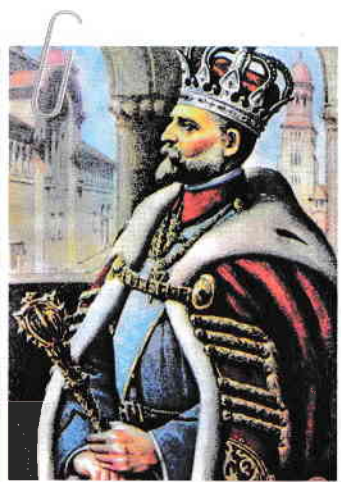
Ferdinand I, rege al României (1914-1927)