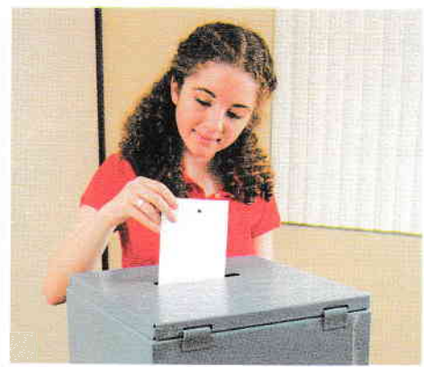
Tânăra care votează pentru prima dată, la împlinirea vârstei de 18 ani