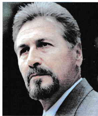
Emil Constantinescu, președinte al României (1996-2000)